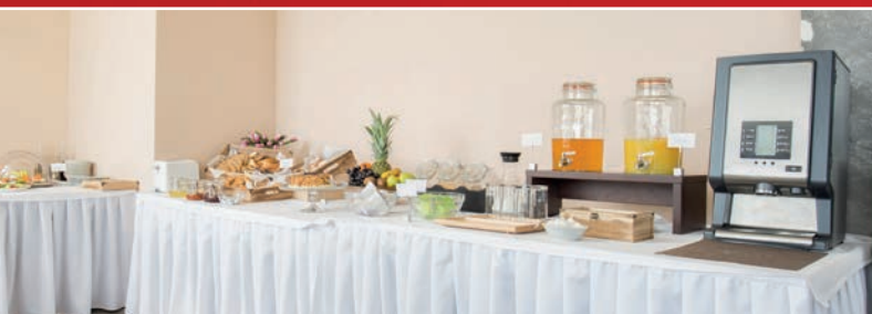
Dystrybutor Bravilor Bonamat

** Wielkość pojemników zależy od wersji urządzenia: 2,4 / 5,3 litra.