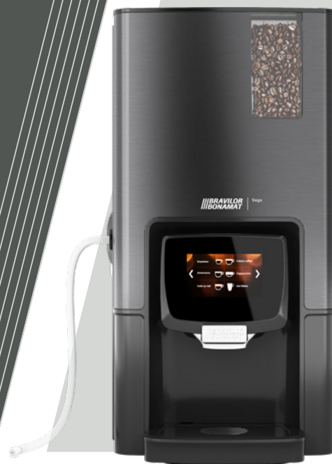
Sego L bez lodówką na mleko