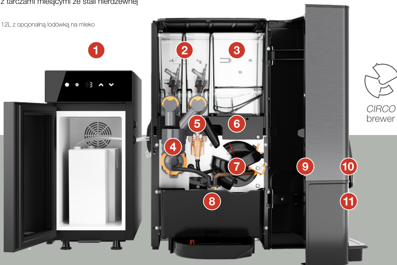
Sego 12L z opcjonalną lodówką na mleko