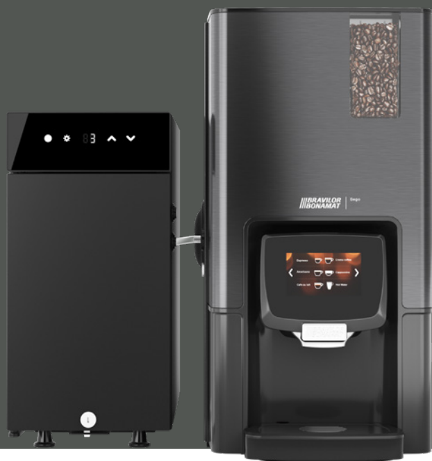
Sego L z lodówką na mleko