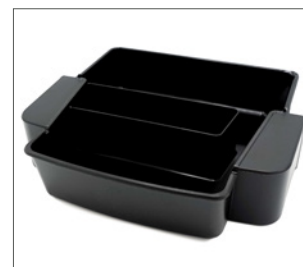
ociekacz do platformy podwyższającej