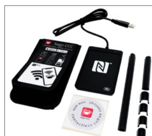
zestaw do aplikacji Sego CCC