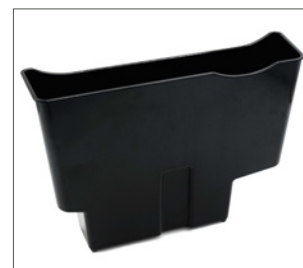
pojemnik na odpady do podwyższenia